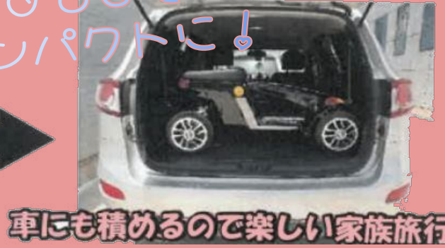
車にも積めるので楽しい家族旅行にも♪