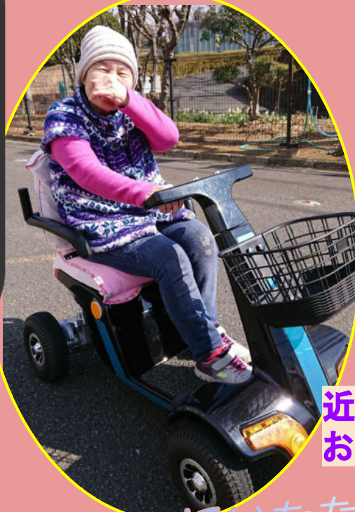
近所の公園にぷらりとお出掛けにもらくらく♪