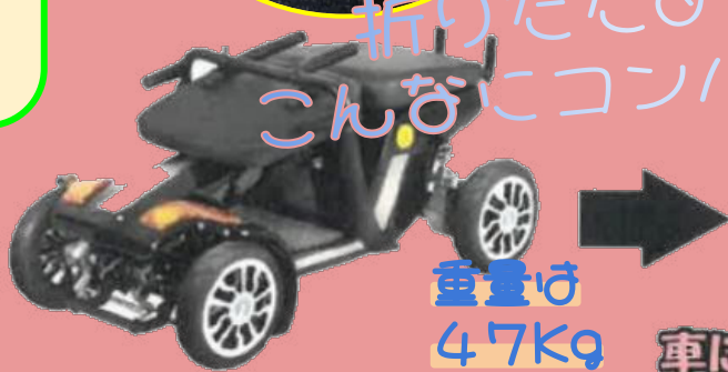
折りたたむのでこんなにコンパクトに！