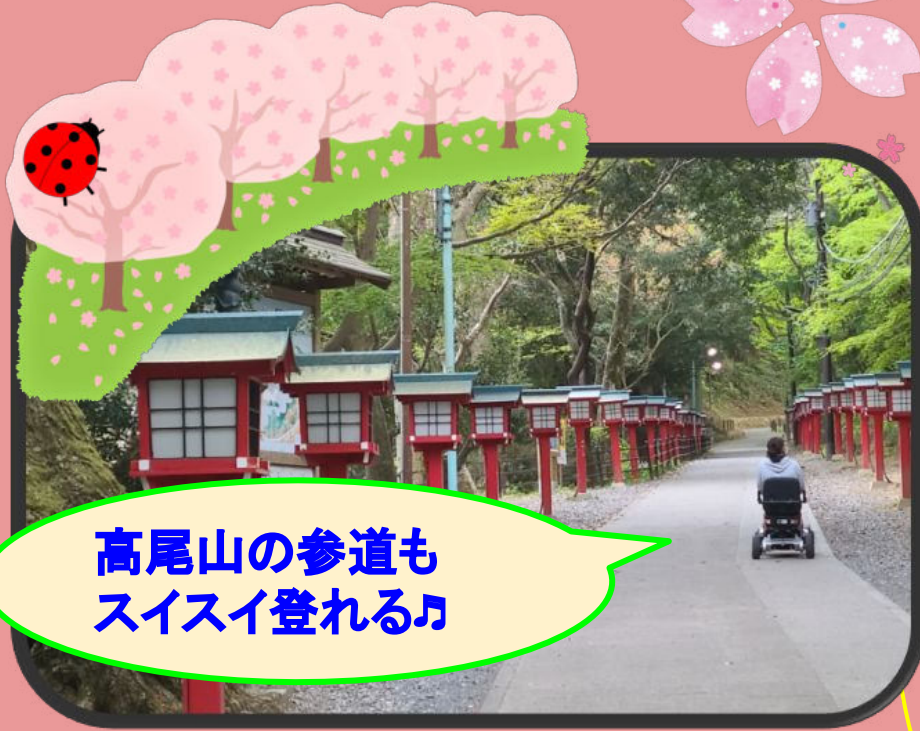
高尾山の参道もスイスイ登れる♪