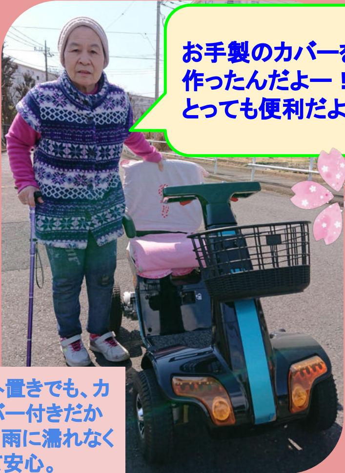
お手製のカバーを作ったんだよー！とっても便利だよ♡